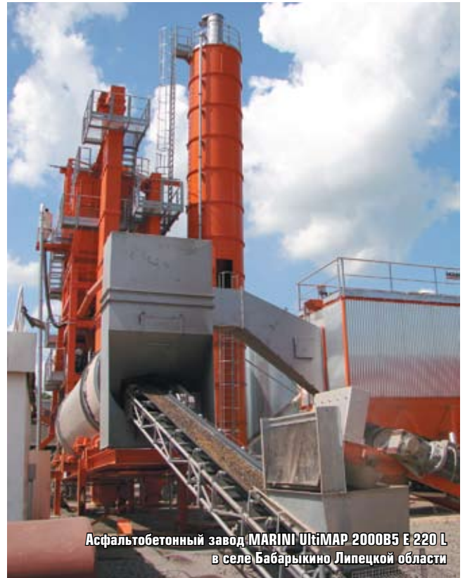
Асфальтобетонный завод MARINI UTMAR 2000B5 E 220 L в селе Бабарыкино Липецкой области

Сейчас, когда предприятие имеет неоспоримые преимущества как по качественным, так и по объемным показателям, настало время закрепить их более совершен-