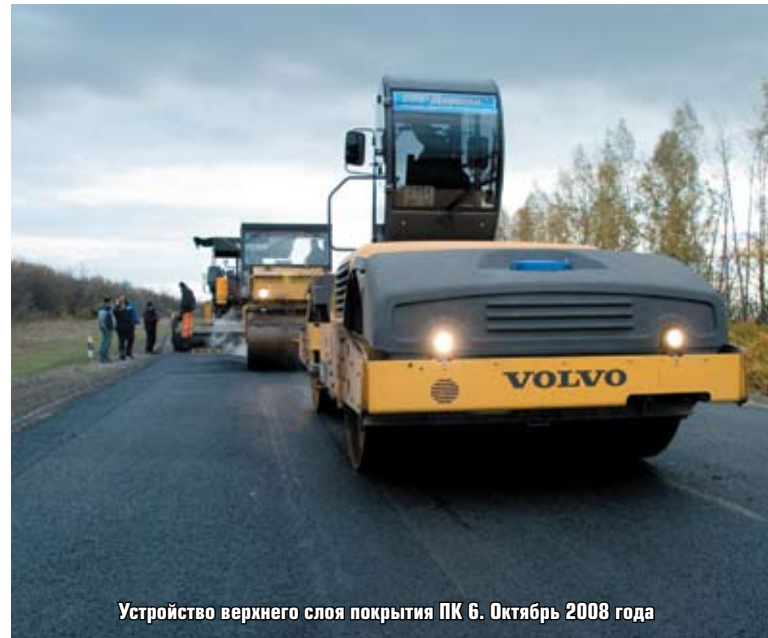
Устройство верхнего слоя покрытия ПК 6. Октябрь 2008 года

Переломным в развитии ООО «Дорога» стал 2000 год, когда по заказу ФГУ Упрдор «Кубань» предприятие выступило генеральным подрядчиком по реализации реконструкции участка автодороги М-29 «Кавказ» км158-км162 (строительство транспортной