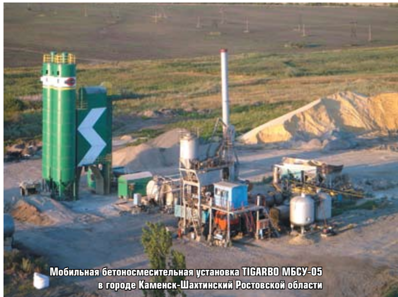
Мобильная бетоносмесительная установка TIGARBO MBSU-05 в городе Каменск-Шахтинский Ростовской области

Но одно дело работать и поддерживать имидж надежной организации в родном крае, и совсем другое – в совершенно незнакомом регионе. Чтобы перебазировать даже часть людей и техники, притом не за сотни, а за тысячи километров, нужно было приобрести еще одно важнейшее для современного предприятия качество – высокую мобильность.