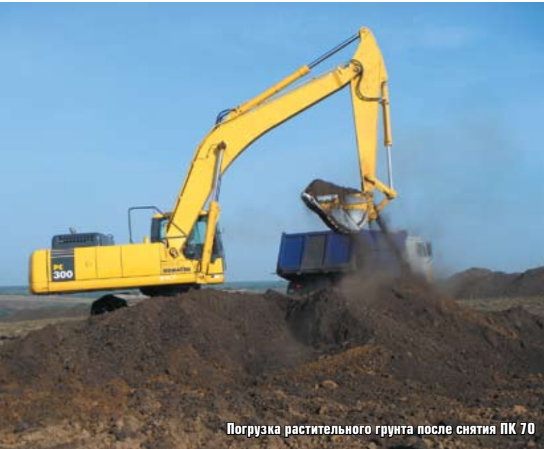
Погрузка растительного грунта после снятия ПК 70

Да, начинали мы с малого — с гравийных сельских дорог, благоустройства предприятий агропромышленного комплекса (АПК). И нам, можно сказать, повезло в том, что свой первый опыт мы приобрели именно в Краснодарском крае, где развитию дорожной сети всегда уделялось большое внимание, а сельскохозяйственные предприятия крепко стояли на ногах.