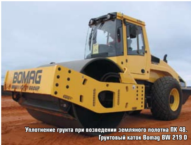
Уплотнение грунта при возведении земляного полотна ПК 48. Грунтовый каток Bomag BW 219 D

В числе постоянных заказчиков ООО «Дорога» числятся ФГУ ФУАД «Черноземье», ФГУ Упрдор «Кубань», ФГУ «Северный Кавказ», ФГУ ДСД «Центр», ГК «Автодор», «Управление автомобильных дорог по Краснодарскому краю», «Управление автомобильных дорог» администрации Воронежской области.