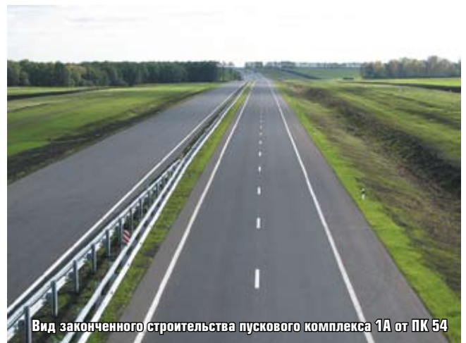
Вид законченного строительства пускового комплекса 1А от ПК 54