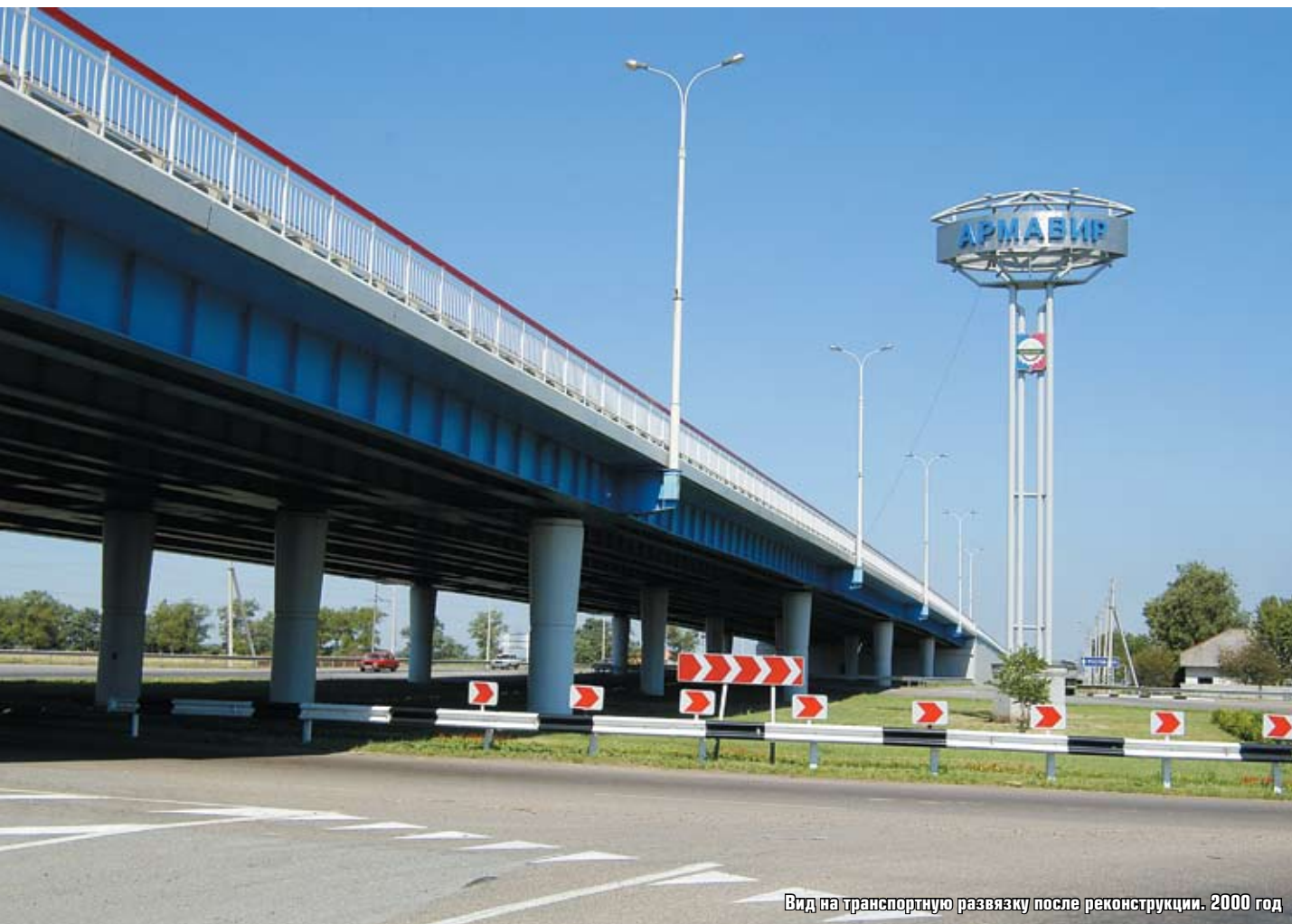
Вид на транспортную развязку после реконструкции. 2000 год