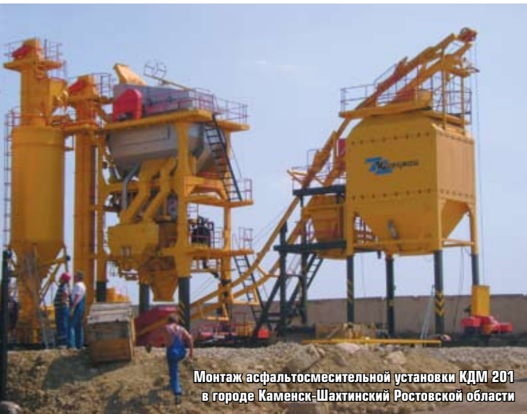
Монтаж асфальтосмесительной установки КДМ 201 в городе Каменск-Шахтинский Ростовской области