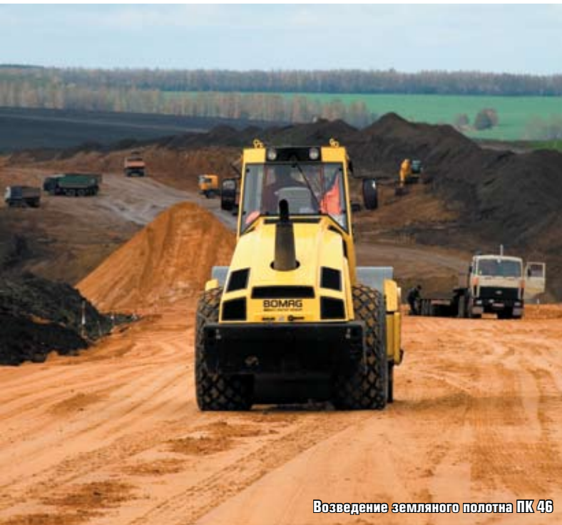
Возведение земляного полотна ПК 46

В 1994 году предприятие сумело выиграть тендер на приобретение местного асфальтобетонного завода. А иметь свой асфальт для дорожно-строительной организации — огромный плюс. Однако и этого преимущества руководителю показалось мало. Подходы предприятия к вопросам качества сразу отразились